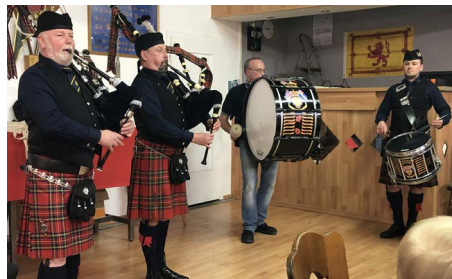
Schottische Klänge dank der Pipes & Drums-Band.

denfalls musste der Barman Jimmy zweimal