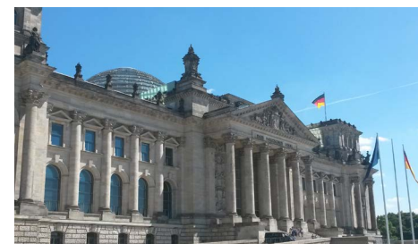
Rainer Spiering lädt zum Girls' Day in den Bundestag ein.

Du hast Interesse am Girls' Day teilzunehmen und bist zwischen 16 und 18 Jahre alt? Dann sende bis zum 15.02.2019 eine E-Mail an rainer.spiering@bundestag.de