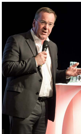
Boris Pistorius, Nds. Innenminister und MdL.