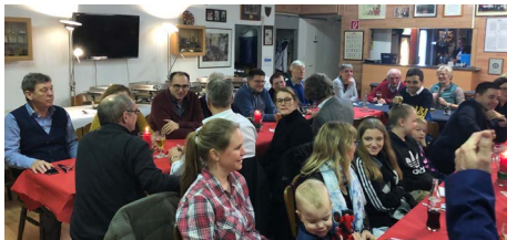
Volles Haus bei der Royal British Legion in Osnabrück.

Die SPD-Fraktion hatte ihr jährliches Grünkohlessen am 17.01.2020 in der Royal British Legion. Die Royal British Legion ist ein eingetragener Verein, der nach dem 1. Weltkrieg als Wohltätigkeitsorganisation zur Versorgung der Veteranen, Witwen und Waisen gegründet wurde. Sein Zeichen ist die Mohnblume, die Poppy, wie der Brite sagt, in Erinnerung daran, dass auf den Schlachtfeldern Flanderns 1918 nicht anderes mehr wuchs außer Mohnblumen. Heute