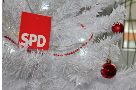
Frohe Weihnachten und ein gesundes neues Jahr!

OV ALTSTADT-WESTERBERG-INNENSTADT , 19 Uhr: Weihnachtssitzung per WebEx (Einladung erfolgt).