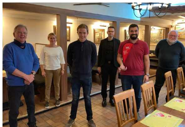
Der neue Vorstand des Ortsvereins Neustadt-Schölerberg-Nahne.