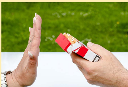
Zigarette? Nein danke! – Die SPD-Regionalgeschäftsstelle ist nun Nichtraucher*innen-Geschäftsstelle.

Ab Januar 2021 ist Tabakwerbung in Deutschland weitgehend verboten. – Die Osnabrücker SPD-Regionalgeschäftsstelle ist hier schon einen Schritt weiter: „Wir sind nun Nichtraucher*innen-Geschäftsstelle.“ Bezirks- sowie Abgeordnetenmitarbeiter*innen vor Ort sind allesamt sehr erfreut über diese Entwicklung.